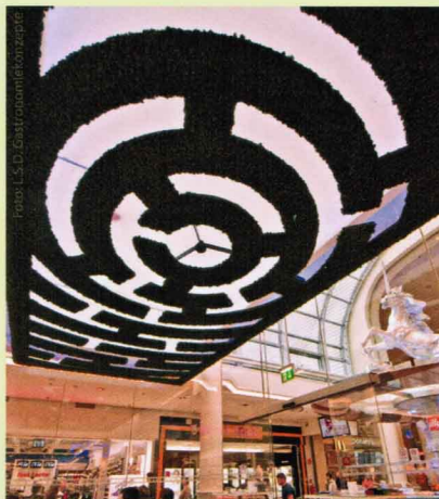
Im Toscana-Café absorbiert ein Deckenlabyrinth aus Mooselementen den Schall (Konzept: L.S.D. Lintschinger & Stieglmayr Design GmbH, Fischlham/Österreich).