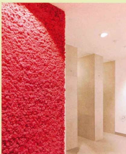
Mooswände in den Sonderfarben Pink und Blau weisen im Münchener Fitness- und Gesundheitsclub Circle den Weg zu den Duschräumen der Damen bzw. der Herren.